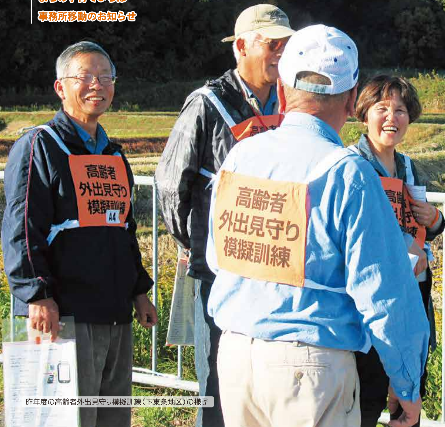
昨年度の高齢者外出見守り模擬訓練(下東条地区)の様子

令和2年度 赤い羽根共同募金 地域包括支援センター Information まちの子育てひろば 事務所移動のお知らせ