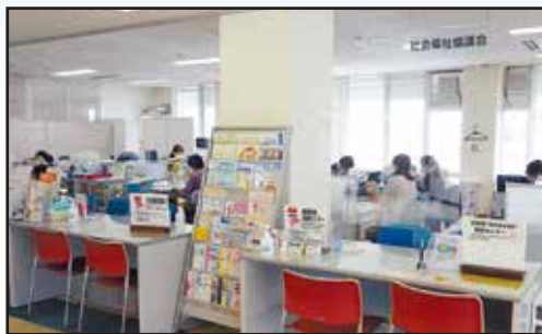
▲ 地域福祉課・地域包括支援センター