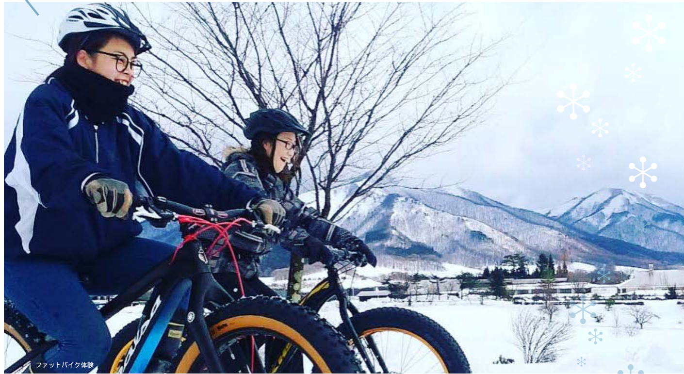
ファットバイク体験

真庭地域のスキー場と温泉のコラボ！ 季刊誌 Gift 持参で！スキー場のリフト券で！ お得に遊んでお得に温泉でまじわを満喫！