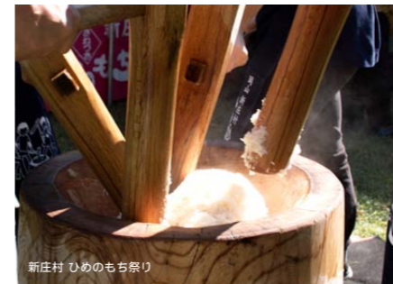
新庄村 ひめのもち祭り