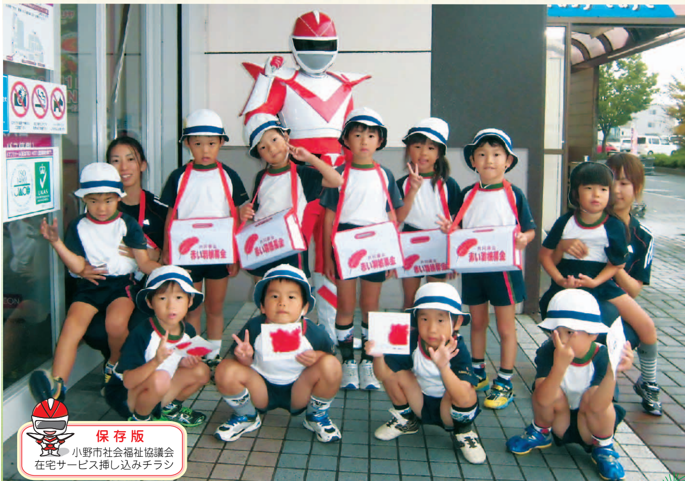
保存版 小野市社会福祉協議会 在宅サービス挿し込みチラシ

赤い羽根共同募金運動に、皆さんのあたたかい ご支援、ご協力を賜り誠にありがとうございました！